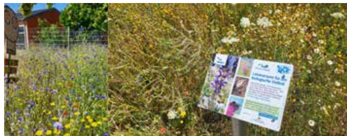
Blühflächen an der Panoramaschule und auf dem Wasserspielplatz

Bei Interesse bitte im Rathaus melden bei: luzy.koertgen@wiesenbach-online.de