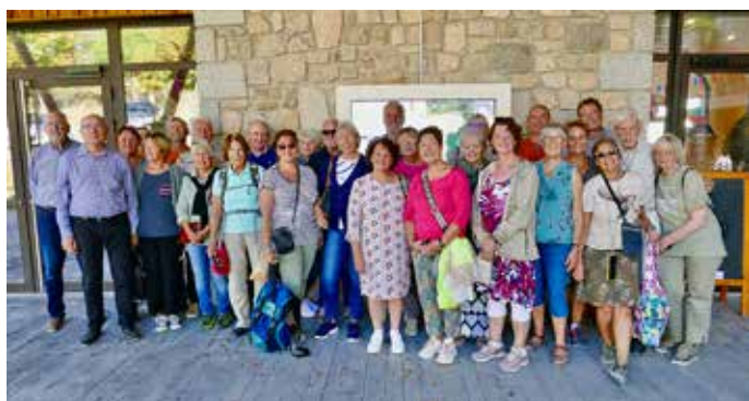
Die Gruppe aus Gaiberg mit ihren Gastgebern aus La Canourgue