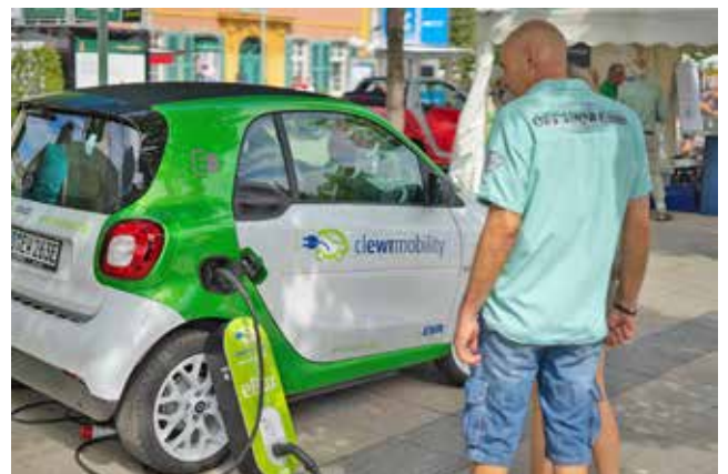
Lieber klein und fein, statt groß und famos!

Weitere Informationen zur Anschaffung eines E-Autos, der Errichtung von Ladeinfrastruktur oder der Beantragung von Fördermitteln gibt es bei der KLiBA. Das Team Elektromobilität steht zu Ihrem individuellen Anliegen gerne beratend zur Verfügung. elektromobilitaet@kliba-heidelberg.de , Fon 06221 99875-32 oder -33