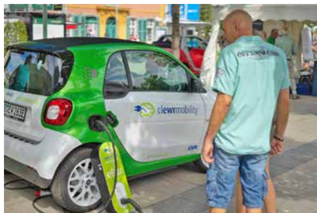
Lieber klein und fein, statt groß und famos!

Weitere Informationen zur Anschaffung eines E-Autos, der Errichtung von Ladeinfrastruktur oder der Beantragung von Fördermitteln gibt es bei der KLiBA. Das Team Elektromobilität steht zu Ihrem individuellen Anliegen gerne beratend zur Verfügung. elektromobilitaet@kliba-heidelberg.de , Fon 06221 99875-32 oder -33