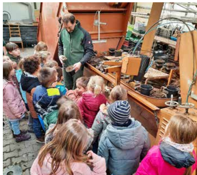
Ein toller Schuliausflug

Zum Abschluss durfte sich jeder Schuli noch ein Hornveilchen aussuchen. Das war echt lieb von der Gärtnerei und wir haben uns riesig darüber gefreut. Klar haben wir uns für die tolle Führung und das Blümchen bei Herrn Diet herzlich bedankt und ihm ein kleines Honigtöpfchen mit Gaiberger Honig geschenkt. B.B.