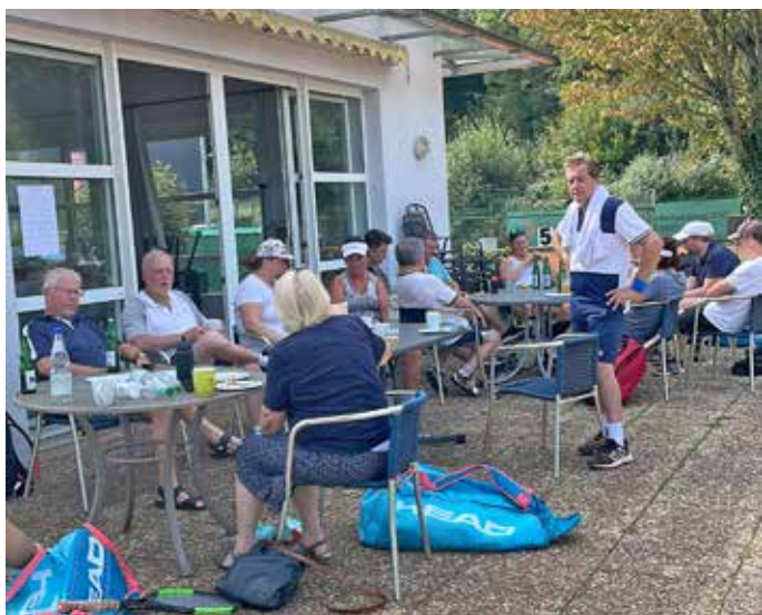
Gute Stimmung auf der Anlage