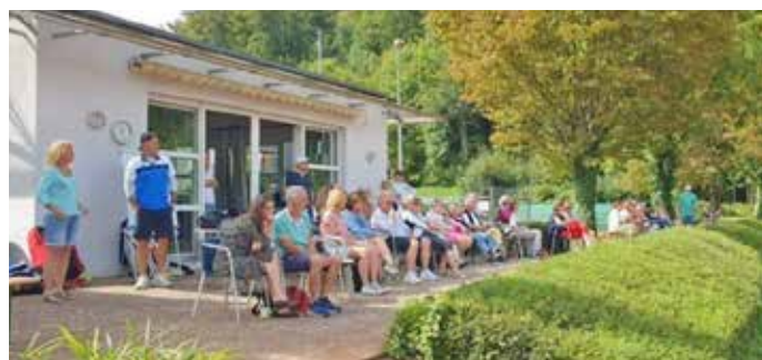
Zahlreiche Zuschauer folgten an beiden Tagen hochklassigem Tennis.