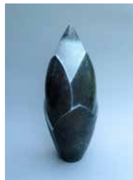
Aufbruch II - lautet der Titel dieser außergewöhnlichen Skulptur

zeigt eine Auswahl beeindruckender Skulpturen aus Stein. Ursprünglich aus der „steinreichen“ Oberpfalz in Bayern stammend, hat er seine zweite Heimat in Nordbaden gefunden. Es erscheint ihm selbst so, als ob die reichlich vorhandenen Kalksteine in der Oberpfalz seine Leidenschaft für die Steinbildhauerei geweckt hätten. Pröbster nähert sich seinen Steinblöcken stets respektvoll, denn oft deutet schon die äußere Form eines Steins darauf hin, welche Skulptur sich in seinem Inneren verbirgt. Diese gilt es nur noch ans Tageslicht zu bringen, wie der Künstler den Besuchern erklärte.