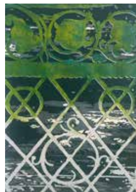
Dieser im Handabrieb gefertigte Druck zeigt ein „Eisengittertor mit sehr schönen Details