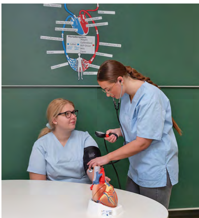
Die Generalistische Pflegeausbildung ist im Kreis weiterhin beliebt: Schülerinnen und Schüler der Louise-Otto-Peters-Schule bei der Ausbildung.

Alle Informationen zu unseren Online Angeboten finden Sie unter: https://www.arbeitsagentur.de/vor-ort/heidelberg