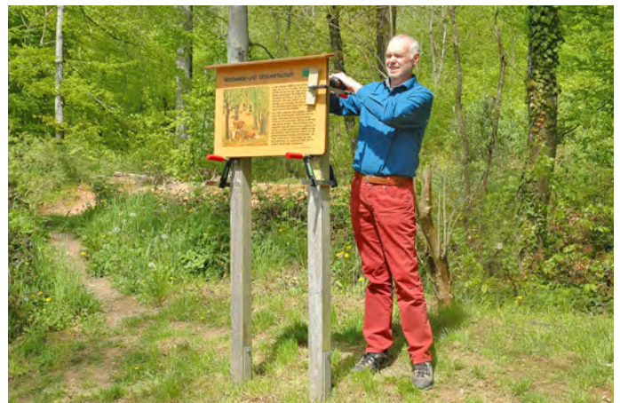
Der Waldthemenpfad informiert interessierte Wanderer und Spaziergänger über die Gaiberger Waldwirtschaft.