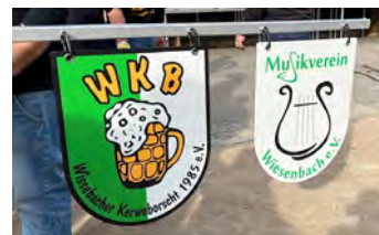
Ein neues Schild des Musikvereins zielt den Maibaum.

Zum Aufstellen des Maibaums auf dem Wiesenschbacher Rathausplatz hatten sich rund 40 Musikerinnen und Musiker eingefunden und sorgten für festliche Stimmung.