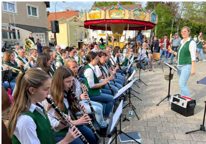
Der Musikverein sorgte für festliche Stimmung.

Wenn der Maibaum, wie oft zu lesen, ein Symbol des neu erwachenden Lebens im Frühling ist, so hat sich dieses gewiss an jenem Nachmittag auf dem Wiesenbacher Rathausplatz vollzogen. Markus Rösch