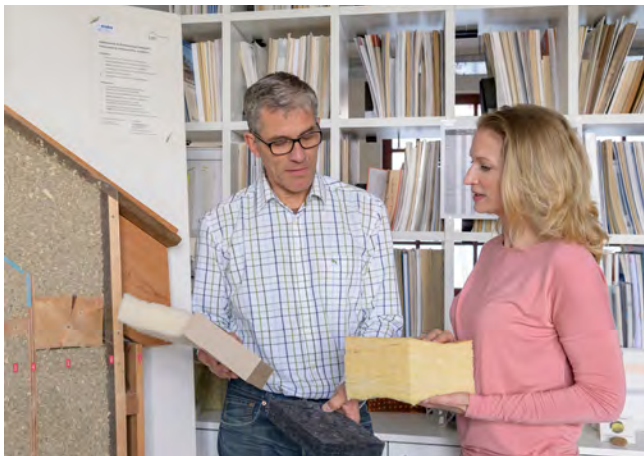
KLiBA-Energieberater informieren Sie umfassend über alle Schritte einer energetischen Sanierung und kennen die richtigen Fördertöpfe.

Nutzen Sie die kostenlose Serviceleistung Ihrer Kommune!