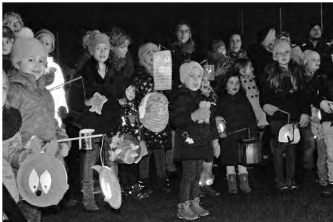
Begeistert sangen die Kinder bei den Martinsliedern mit.