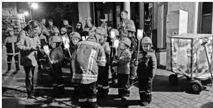
Die Feuerdrachen stehen für den Martinsumzug bereit.

Umtrunk mit Punsch und dem ersten Glühwein der Saison freuen und hatten viel zu besprechen an diesem Martinsabend.