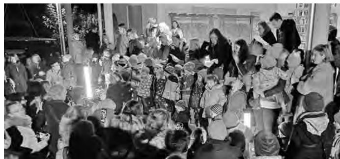
Freudig singen alle Kindergartenkinder das neue Lied „Als Martin ein Soldat noch war...“