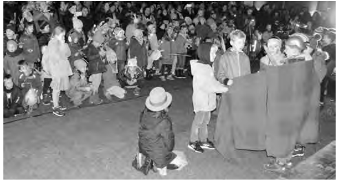
Die Mantelteilung gespielt von der Klasse 3 c der Elsenztschule.