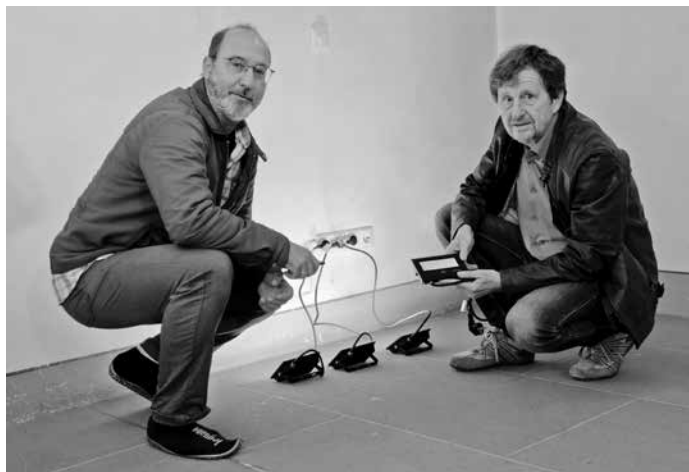
Mit sechs LED-Strahlern kann die Peterskirche nun in allen denkbaren Farben illuminiert werden.

Kreisen, die in der Ev. Peterskirche Veranstaltungen durchführen, nach Anmeldung beim KBV kostenfrei zur Verfügung.