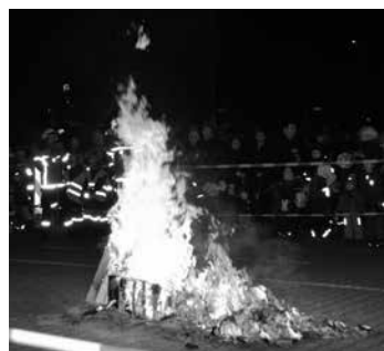
Beim Martinsfeier werden wieder die beliebten Martinsmännchen verteilt.

Durch die Straßen auf und nieder leuchten die Laternen wieder. Rote, gelbe, grüne, blaue, lieber Martin, komm und schaue!... Angeführt von Sankt Martin auf dem Pferd folgen wir der großen Laterne. Im Schein der selbst gebastelten Laternen ziehen wir durch die Rosenstraße und die Straße „In der Au“ zum Parkplatz vor der Biddersbachhalle. Auch in diesem Jahr begleitet uns der Musikverein musikalisch und die Jugendfeuerwehr schützt uns vor Gefahren. Gemeinsam werden wir die Lieder „Sankt Martin ritt durch Schnee und Wind“, „Ich geh mit meiner Laterne“, „Laterne, Laterne, Sonne, Mond und Sterne“ und „Durch die Straße auf und nieder“ singen.