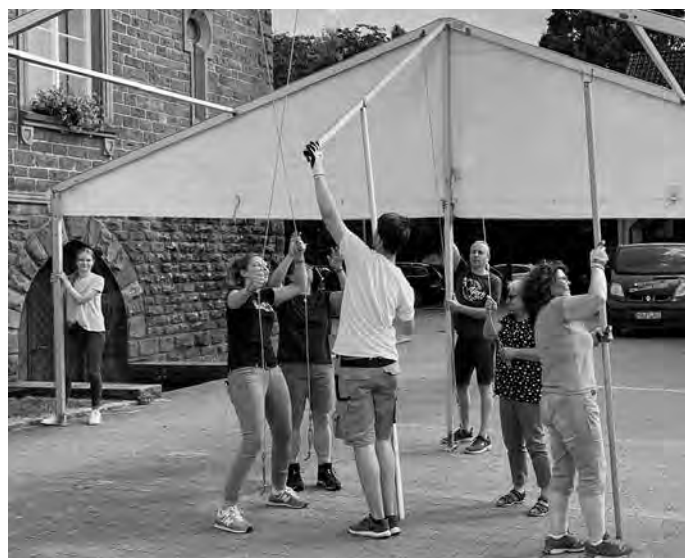
Das Aufstellen der Zelte ist ein Gemeinschaftswerk aller Mitglieder.