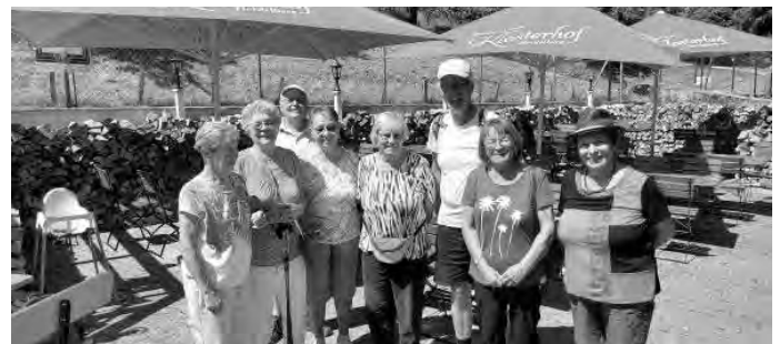
Im Restaurant Benediktinerabtei

Nach kurzer Pause ging's wieder zurück zum Ausgangspunkt. Die Kurzstreckler machten auf halber Strecke halt; und dann ging's wieder zurück. Unser Abschluß fand dann im Restaurant der Benediktinerabtei statt. Temperatur war durchweg ca. 27 Grad, da wir ausschließlich im Wald wanderten.