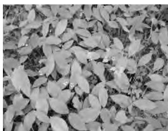
Blätter des Maiglöckchens