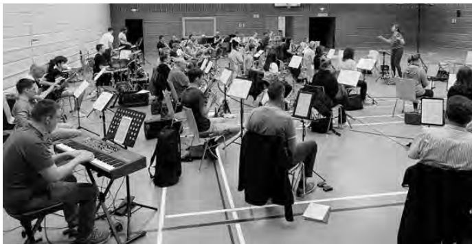
Vorbereitung Frühlingkonzert 2022

Am Samstag, den 7. Mai 2022 um 19:30 Uhr ist es endlich wieder soweit. Frühlingkonzert in der Biddersbachhalle Wiesenbach.