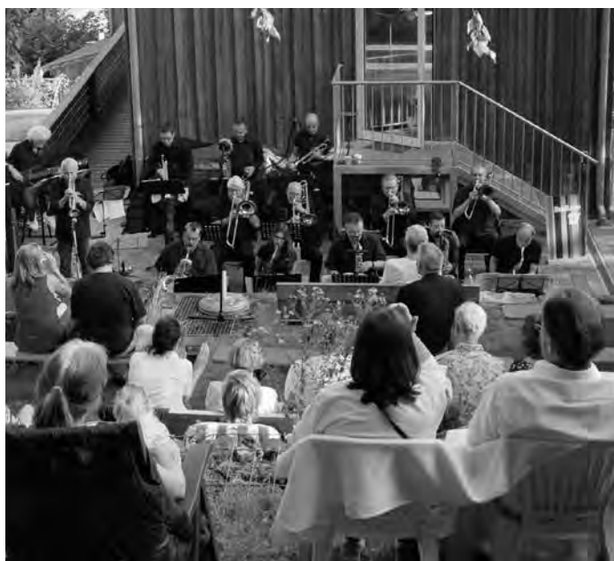
Die Bigband17 vor der Tabakscheuer im Antoniushof

Pressefotos und Hörproben gibt es unter https://bigband17.de/galerie/ Text und Foto Samuel Fleiner