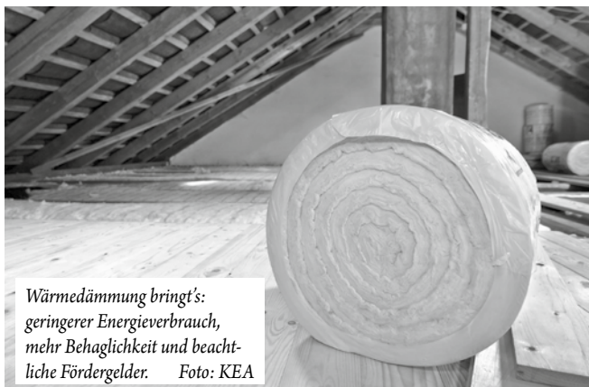
Wärmedämmung bringt's: geringerer Energieverbrauch, mehr Behaglichkeit und beachtliche Fördergelder.

Termine bekommen Sie direkt bei der KLiBA in Heidelberg, Tel. 06221 99875-0 oder E-Mail: info@kliba-heidelberg.de.